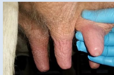
Viele Faktoren beeinflussen die Eutergesundheit, z.B. Sauberkeit und Zustand der Zitzen.

Das Programm EUTERGESUND bietet dafür eine Hilfestellung. Es leitet Schritt für Schritt durch eine Analyse, bietet Unterstützung bei Datenerfassung und -auswertung und stellt eine Liste von spezifischen Handlungsempfehlungen zusammen. Das Tool unterstützt so wissensbasiert das betriebliche Eutergesundheitsmanagement und die Beratung. Durch eine regelmäßige Anwendung des Programms kann mit geringem Aufwand die Herdeneutergesundheit systematisch verbessert und langfristig überwacht werden.