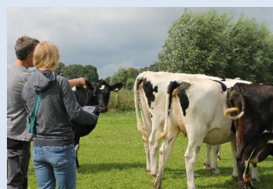
Eine gründliche Ursachenanalyse ist die Grundlage für Verbesserungen.